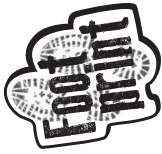
Tabla de puntuación